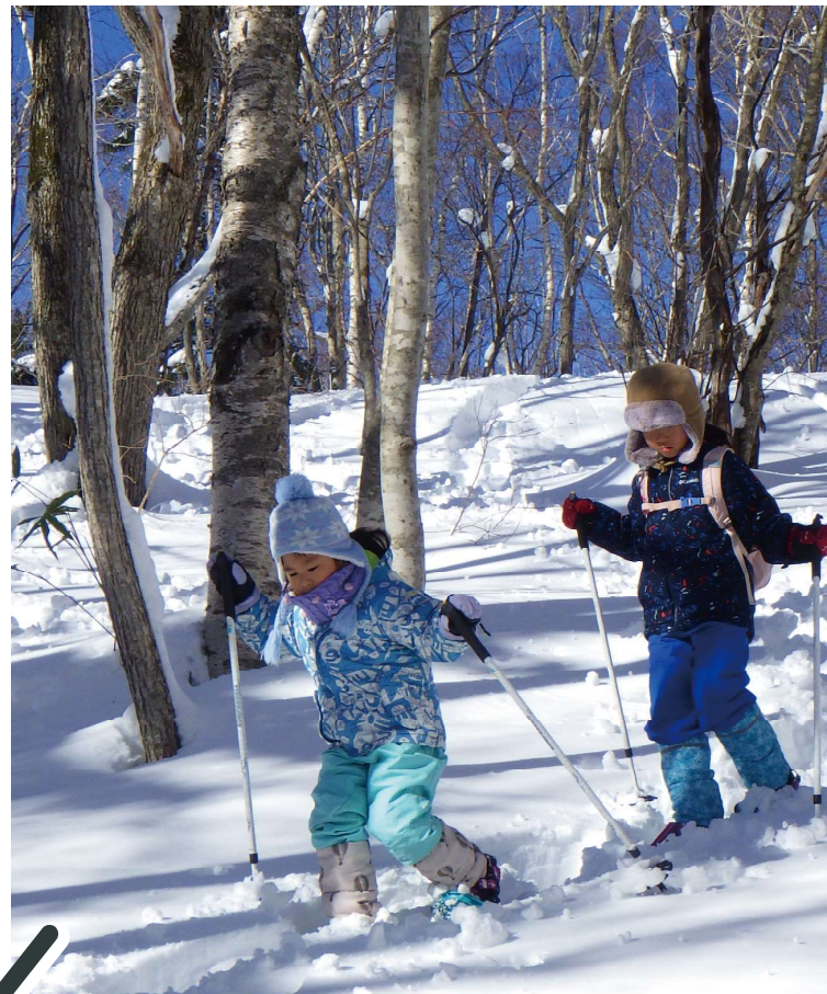
※過去の写真です。 積雪状況によってはご利用できない施設もございます。