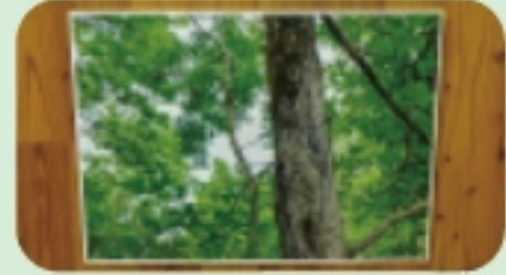
場所 森の情報館 地下1階