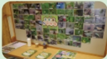
展示場所 森の情報館内

虫が苦手な方にも「かわいい」「おもしろい」 と思っただけのような写真を展示しています!