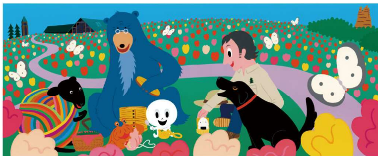
『おばけのマーとおべんとう』（2007年発行）中西出版 ©Rei Nakai/NAKANISHI PUBLISHING CO.,LTD.