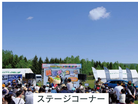
ステージコーナー