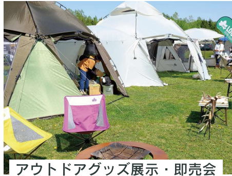
アウトドアグッズ展示・即売会