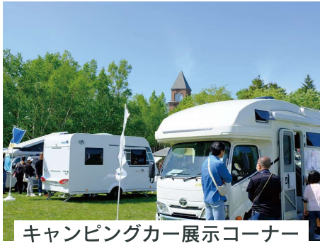
キャンピングカー展示コーナー