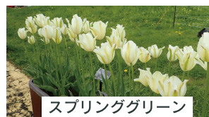
スプリンググリーン