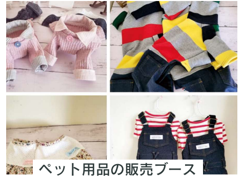
ペット用品の販売ブース